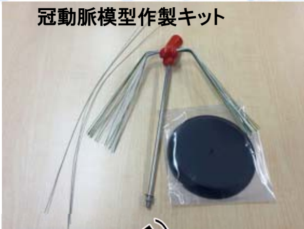
冠動脈模型作製キット